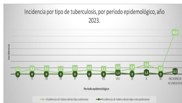
Figura 2. Incidencia por tipo de tuberculosis, desagregado por período epidemiológico, año 2023.

En el 2023 se refleja que la Tuberculosis Pulmonar tiene una tasa de incidencia acumulada de 33, la mayor incidencia de Tb pulmonar se presentó en el período epidemiológico XI.