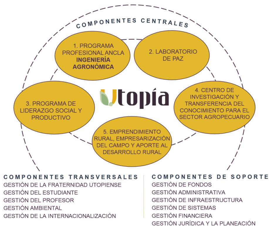
Figura No.1: Componentes de Utopía