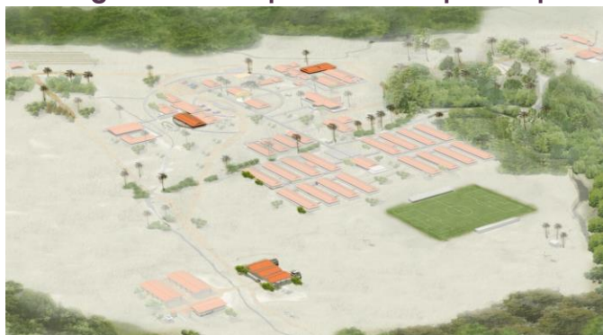
Imagen No. 3: Etapa 3 del Campus Utopía