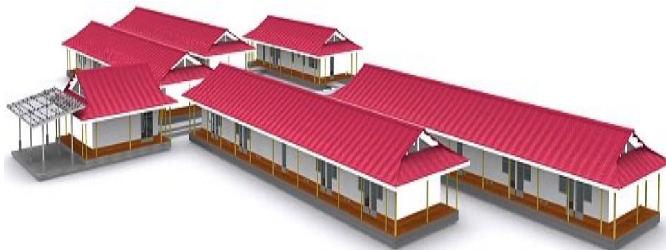
Imagen No. 4: Etapa 4 del Campus Utopía (Edificio: Alojamiento estudiantes)