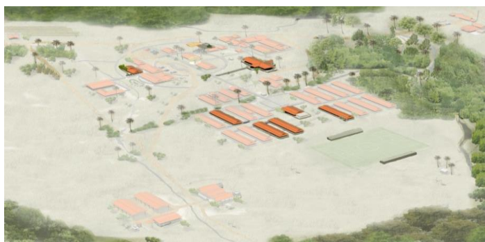
Imagen No. 2: Etapa 2 del Campus Utopía