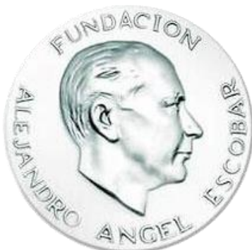
Premio Nacional de Solidaridad 2016

Premio Nacional de Solidaridad – Fundación Alejandro Ángel Escobar, 2016