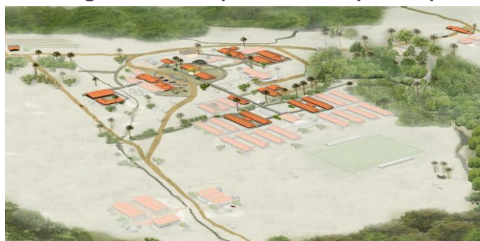
Imagen No. 1: Etapa 1 del Campus Utopía