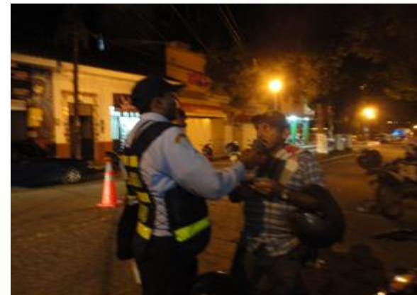
CONTROL OPERATIVOS EN LA NOCHE, PLAN EMBRIAGUEZ1