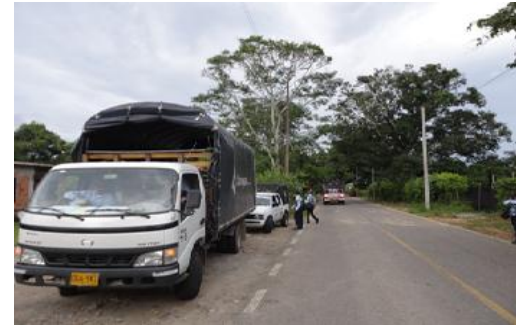
CONTROL VEHÍCULOS DE CARGA, PESADOS E INDIVIDUAL1