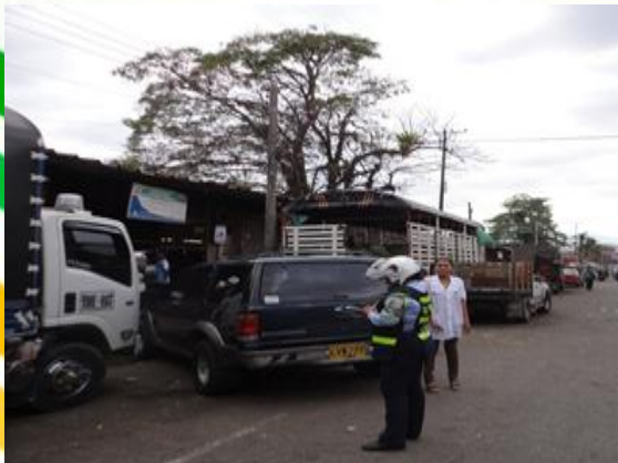
CONTROL PLAZA DE MERCADO