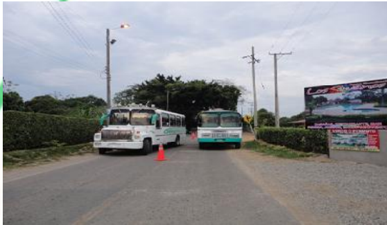
CONTROL VEHÍCULOS DE CARGA, PESADOS E INDIVIDUAL1